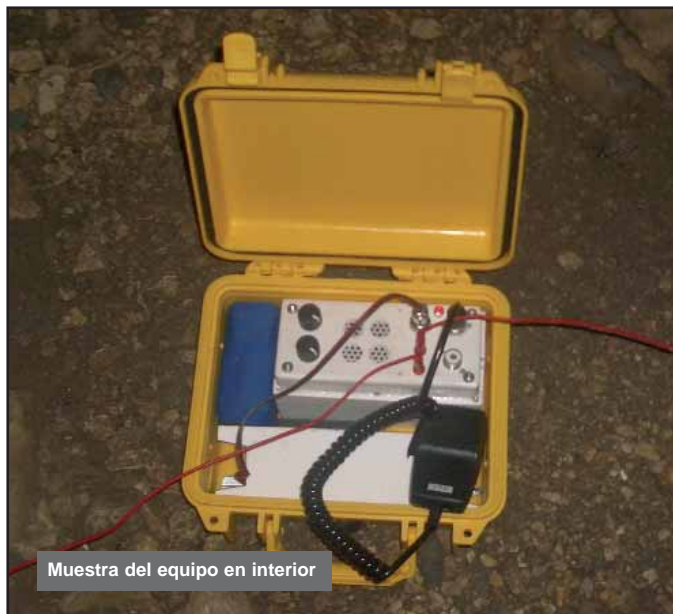
Muestra del equipo en interior