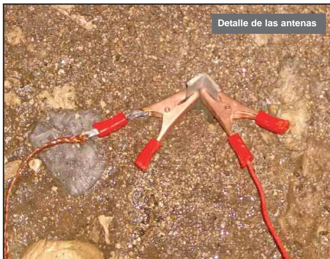
Detalle de las antenas

Debido a fenómenos meteorológicos, perturbaciones atmosféricas o interferencias con otros sistemas de radio, las transmisiones de los equipos pueden verse afectadas. El sistema LORAN de navegación Europea por satélite genera un ruido característico en los equipos de superficie. Se parece a un ruido motorizado y periódico, muy carac-