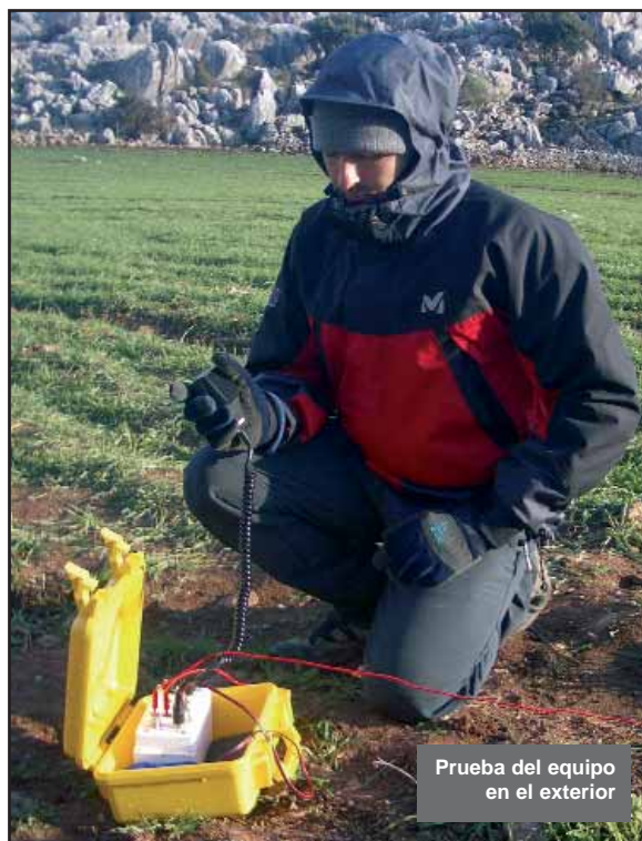
Prueba del equipo en el exterior